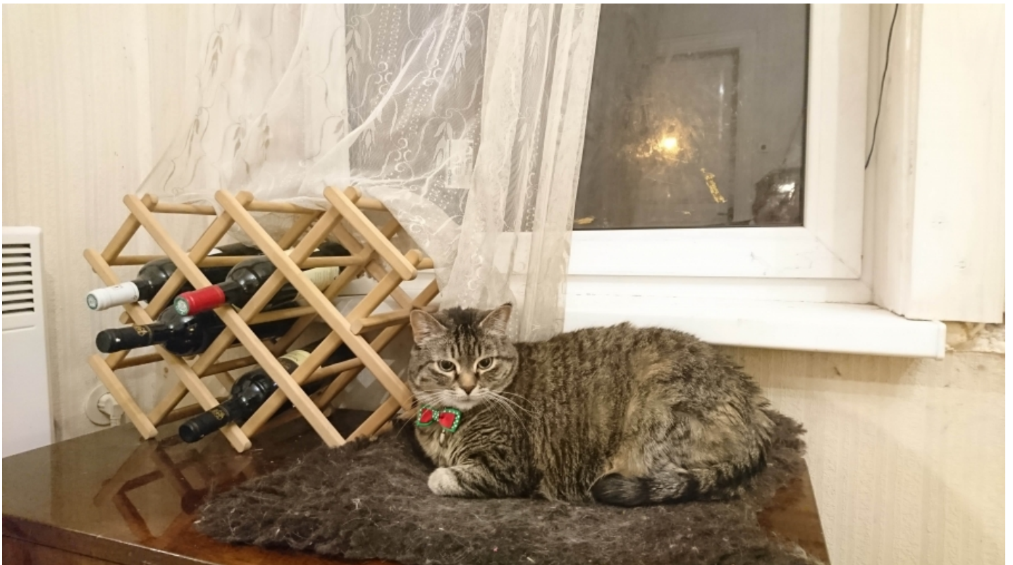
Sony Xperia XZ.

Automaatrežiim teeb valges päris häid pilte, ning ägeda nimega hübriidfookus kiirendab fokuseerimist ka liikuvate objektide puhul. Olgugi, et Sony toodab sensoreid väga palju ka teistele brändidele ja väga häid, pole pildid Sony enda seadmes mitte tippklassist, vaid pigem kõva keskmine. All on pildid Aasta Telefoni finalistide kaameratest. Klõpsa pildil, avaneb originaal.