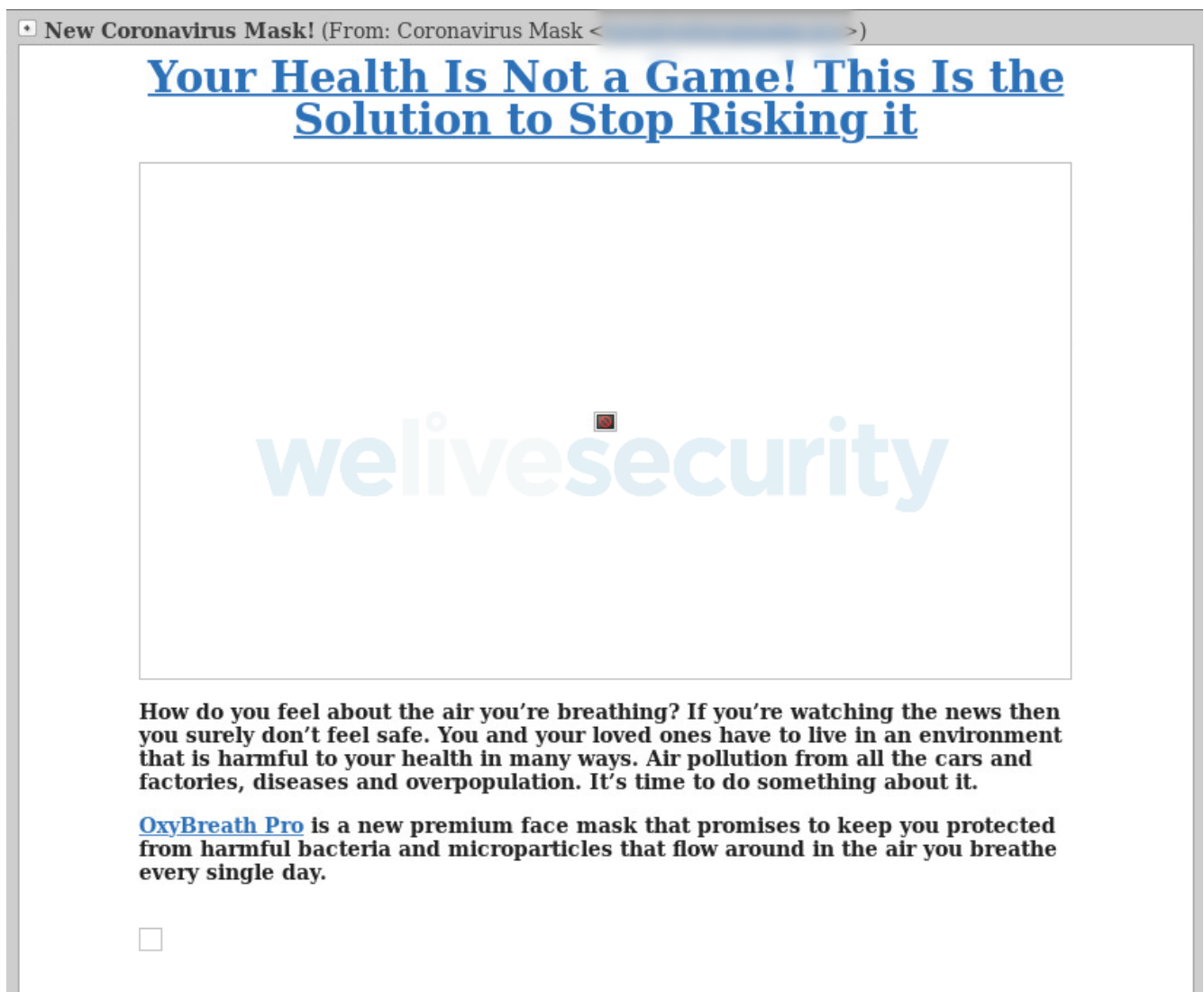
Joonis 4. Petturite näomaskide pakkumised.

Seda tüüpi pettuste korral saadavad petturid rämpspositusi, mis panevad inimesi uskuma, et ilma maskita ei ole nad viiruse eest kaitstud ja pakuvad maskide tellimist. Selle tulemusel avaldavad ohvrid petturitele tahtmatult ka oma isiklikku ja rahalist teavet.