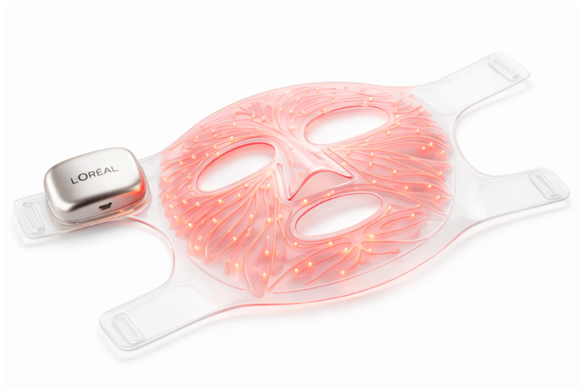
L'Oréal LED Face Mask.

Las Vegases toimunud messi järelkajana on jõudmas lettidele L'Oréali valgusetendus. On see ikka nii tõhus kui keemiaga möllamine või vana hea kurgimask? Tehnoloogiahuvilised võiksid siin kahelda. Aga tootja lubab, et sel on ikka mõju küll, eriti meie pimedas ja külmas kliimas.