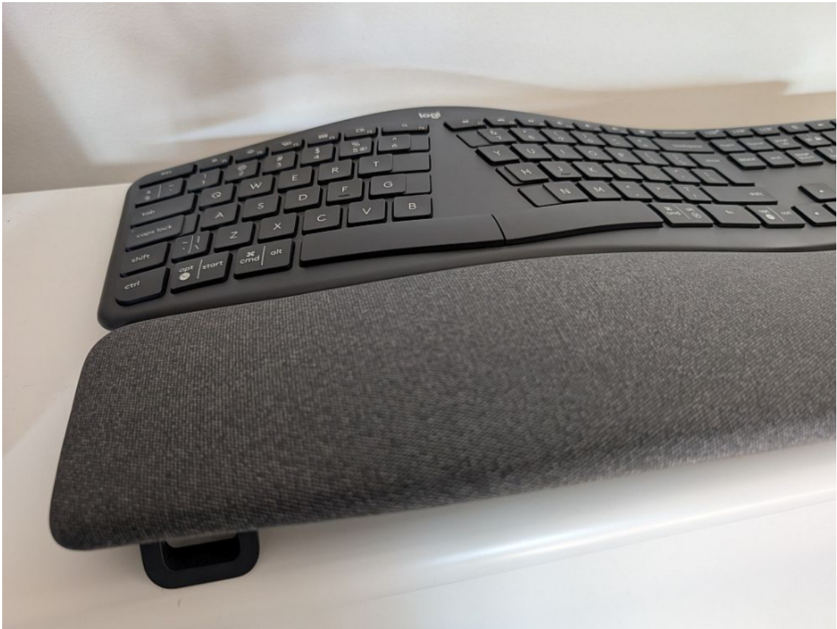
Jalg tõstab just esimest randmetoe-poolset serva.

Toiteallikana kasutab klaviatuur kaht AAA-tüüpi patareid, mis kestavad tootja sõnul kuni kaks aastat. Oluline lisaväärtus on ühilduvus tarkvaraga Logi Options+ , mis võimaldab seadistada 12 programmeeritavat klahvi vastavalt oma vajadustele (näiteks mikrofoni vaigistamine või teksti dikteerimine). Samuti toetab see Logitech Flow tehnoloogiat, mis tähendab, et kui kasutate selliseid hiiri nagu MX Master 2S, MX Master 3 või MX Anywhere 3, liigub klaviatuuri ühendus automaatselt koos hiirega ühest arvutist teise.