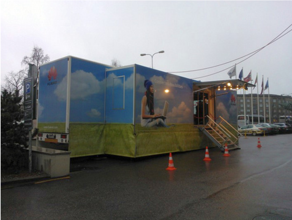
Huawei Roadshow veok Tallinnas Olümpia ees.

Järgmise aasta esimeses pooles võib Eestis müügile tulla uus mobiil Huawei Ascend P1 kõigi kolme operaatori jaeketis. Seni on Huawei nutitelefone müünud Eesti turul peamiselt Elisa Eesti. Huawei U8500 on esindatud ka EMT telefonide müügiedetabelis viie müüduima mudeli seas Samsung Galaxy ja Apple iPhone 4S kõrval.