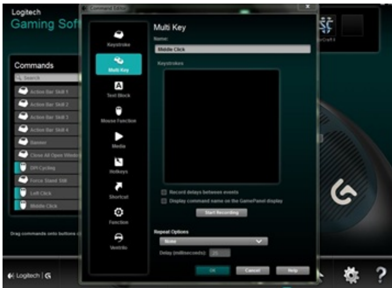
Pilt 3. Nuppude täppis-seaded.

Kokkuvõttes on Logitech välja tulnud odavapoolse mängurihiirega (39 Ameerika dollarit kodulehe järgi), mis on mõeldud nii parema- kui ka vasakukäelistele. Kahekäelisuse tõttu jätab hiir natukene soovida ergonomika osas. Logitech on läinud turvalist teed ja teinud hea universaalse hiire, aga mitte hiire, millega oleks nauding mängida. Need kaks küljenuppu ei anna rahu, kasvõi netis sirvimiseks. Hiir võiks ju olla võimekas ka mujal kui mängimisel: kasvõi arvutitöödel, fototöötlustes!