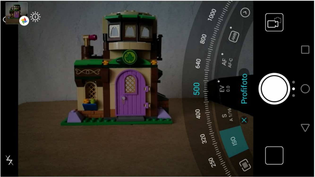
ISO 3200-ga on pilt tunduvalt heledam, aga teralisus suurem: