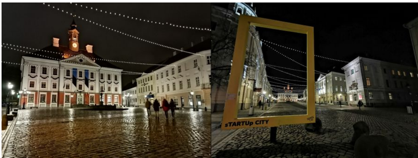
Vasakpoolne P Smart Pro pilt on seekord küll värviderohkem kui eelmine, aga sellist lainurka, nagu Mate 20 Pro'l, testitav telefon öövõttega ei paku.

Üldiselt saab P Smart Pro'ga samuti täiesti korralikke pilte teha, kuid kvaliteedi stabiilsus on kehvem kui tippkaameratega - automaatika teeb eksimusi värvide määramise ja teravustamisega rohkem, aga kui teed vanakooli moodi rohkem klõpse samast asjast, siis lõpuks mõne hea kaadri ikka leiab.