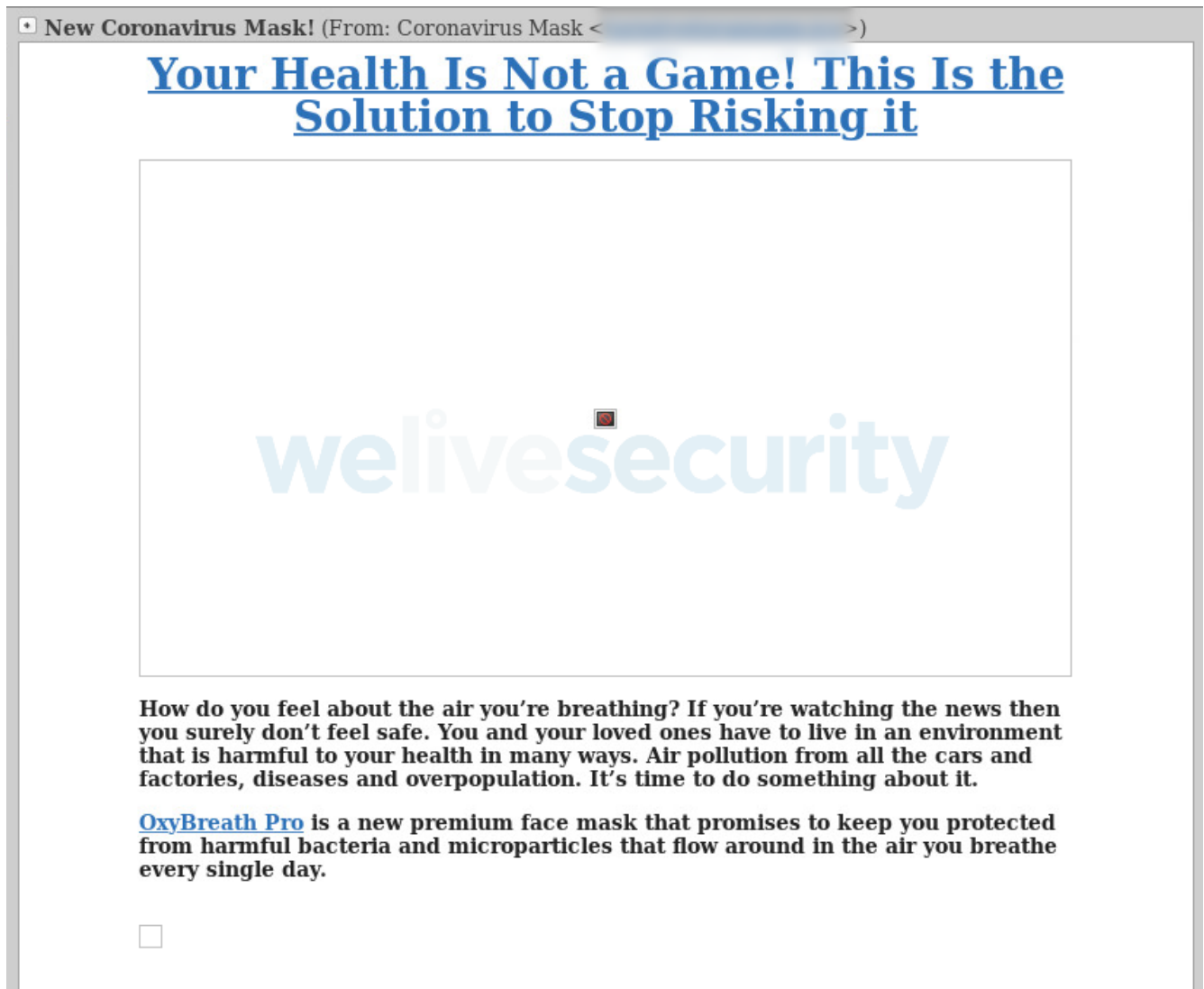
Joonis 4. Petturite näomaskide pakkumised.

Seda tüüpi pettuste korral saadavad petturid rämpspositusi, mis panevad inimesi uskuma, et ilma maskita ei ole nad viiruse eest kaitstud ja pakuvad maskide tellimist. Selle tulemusel avaldavad ohvrid petturitele tahtmatult ka oma isiklikku ja rahalist teavet.