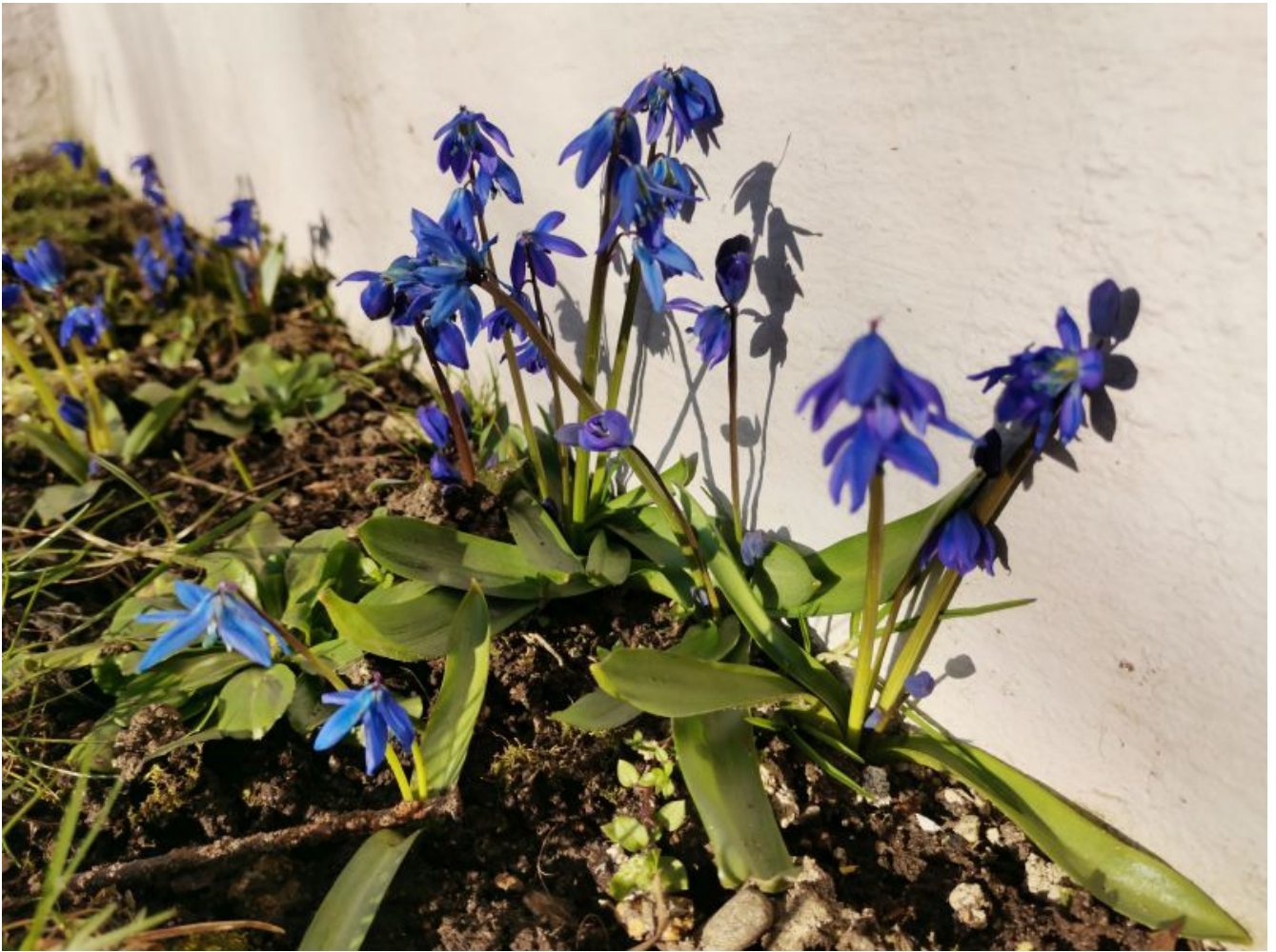
Siin üks näide ka bokeh ´ist: