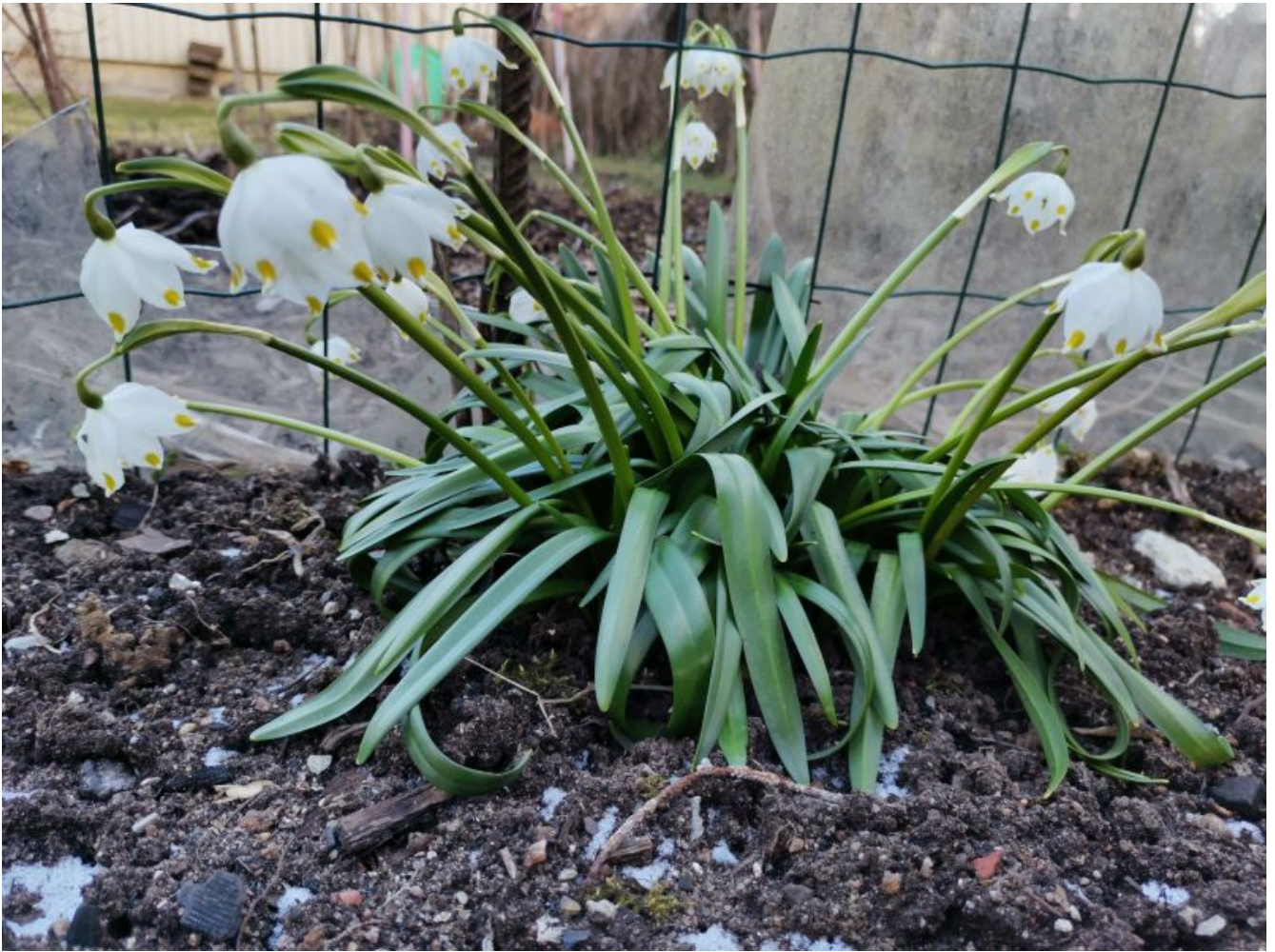
Klõpsa piltidel, avaneb originaal.