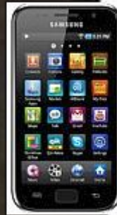
AlcoGait (Smartphone sensing)