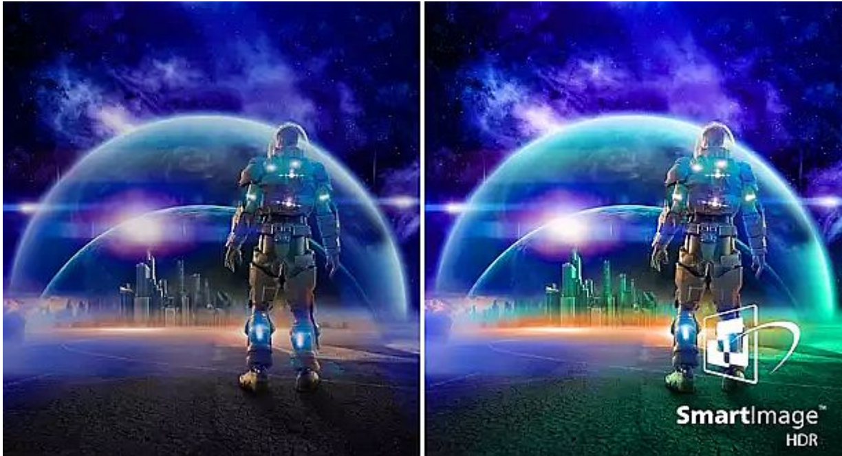
foto- või videotöötlust teevad. HDR tugi sobib nii filmide vaatamiseks kui HDR-toega mängude mängimiseks, kus varjus redutavad vaenlased on samuti näha.

Monitoril on stereokõlarid, kaks HDMI 2.0 porti, DisplayPort 1.4 ja USB pordid. USB-B striimib üles, neli USB 3.2 porti aga lubavad kuvarit dokina kasutada, lisades vajalikud lisaseadmed mitte arvuti, vaid otse ekraani külge.