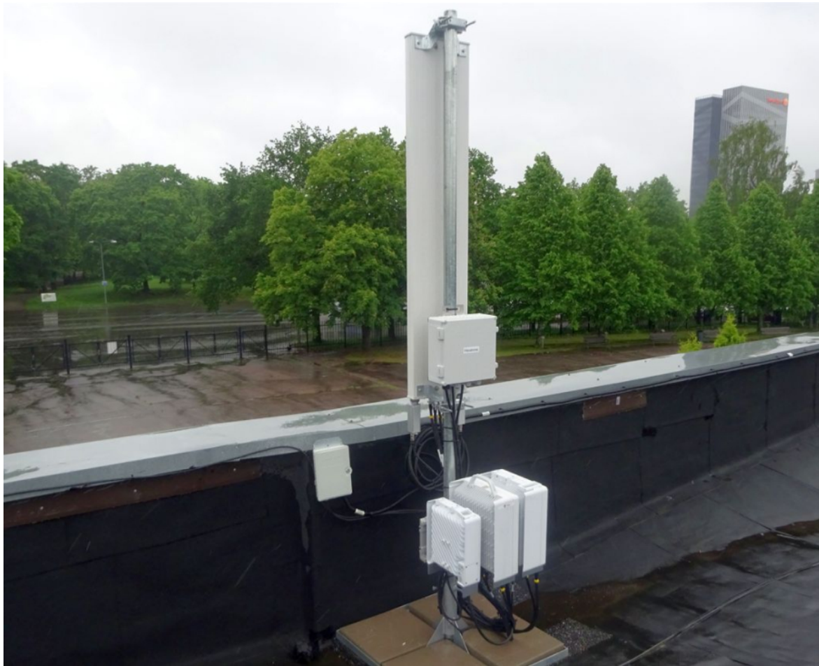
Telia ajutine mobiilsidejaam Kalevi sataadionil.

Tähelepanuväärne on ka välismaiste küllastajate suur osakaal – laulupeo suurkontserdi päeval ehk 6. juulil moodustasid rändlusteenust kasutavad kliendid 11,8% kõigist Telia võrgu kasutajatest. Tantsupeo puhul oli väliskülaliste osakaal veelgi suurem – 13,4%. Need näitajad kinnitavad Eesti rahvusliku suursündmuse kasvavat rahvusvahelist tähtsust.